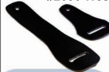
Leather Epaulet MIC Holders

Clothing & Gear That Commands Attention #2686 West Edmonton Mall - (780)444-1540