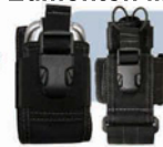
Maxpedition Radio & Cell Phone Holsters