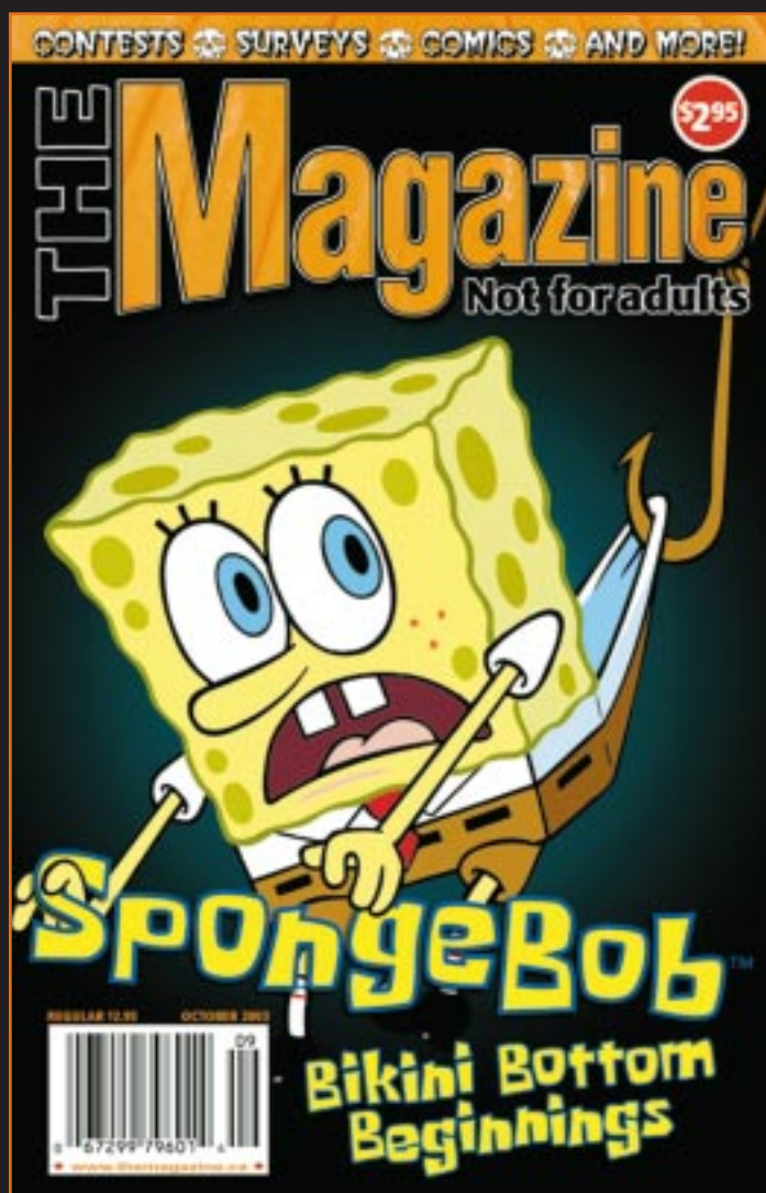
Couverture d'octobre : The Magazine – Not for Adults

* Les revenus des ventes de l'Ontario sont partagés entre Kids Help Phone et l'Association des chefs de police de l'Ontario.