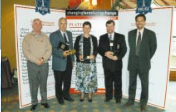
Représentants des Commanditaires Platines, de l'Association des banquiers canadiens, du ministère de la Défense nationale, de Sears Canada Inc., de Microsoft et de la GRC, dont les mérites ont été reconnus à la réception des dignitaires.