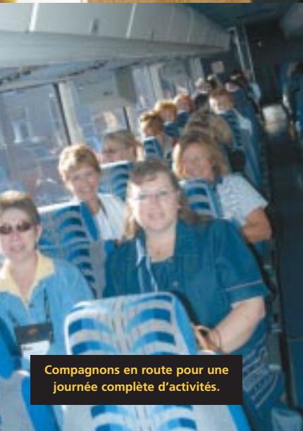
Compagnons en route pour une journée complète d'activités.