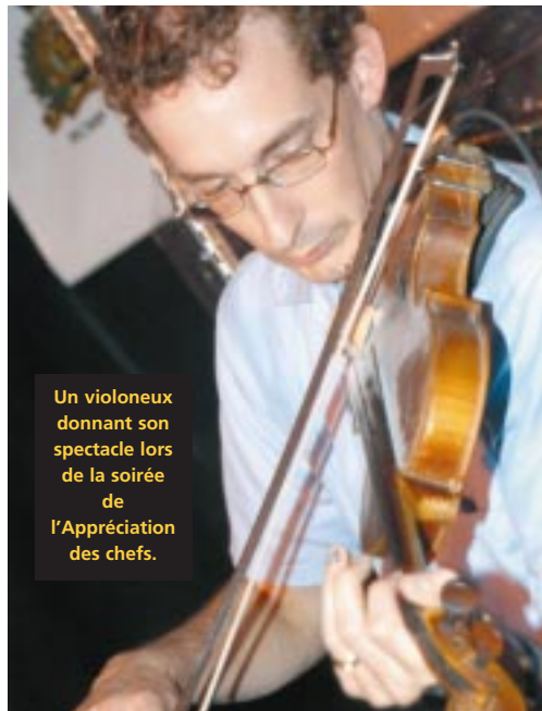
Un violoneux donnant son spectacle lors de la soirée de l'Appréciation des chefs.