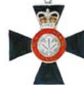
L'Ordre du mérite des corps policiers