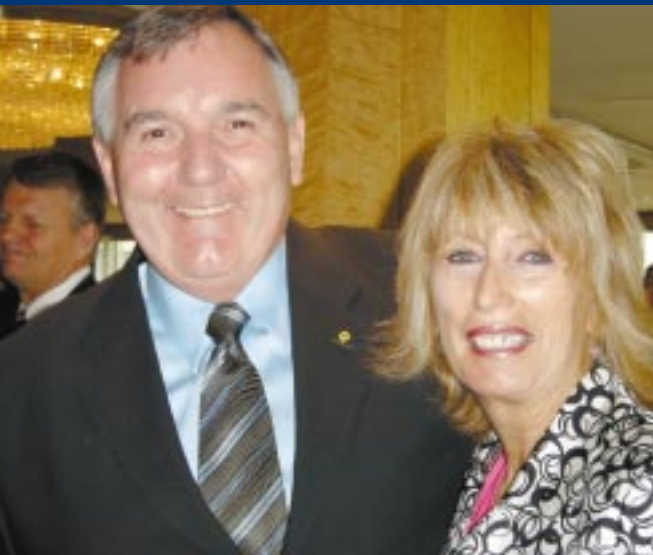
Les représentants de Securiguard et d'Electronic Arts Inc., commanditaires de la conférence de l'ACCP pour 2004.