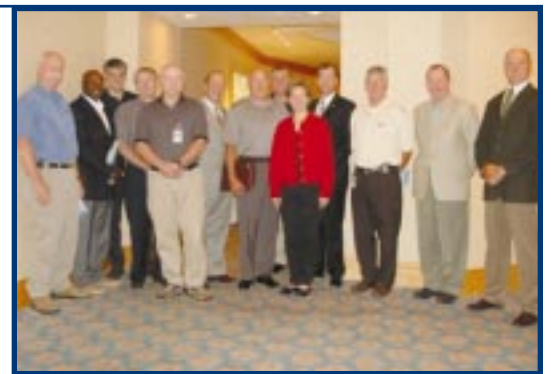
Présidents des comités de l'ACCP 2004-2005

Aimeriez-vous collaborer avec vos pairs à la réalisation de projets importants pour les services policiers du Canada ? Les comités de l'ACCP recherchent des membres qui désirent prendre part à des activités visant à soutenir les efforts déployés par l'ACCP pour stimuler la transformation progressive des services policiers. Engagez-vous dès aujourd'hui ! Pour prendre connaissance de la liste complète des comités et de leur mandat, veuillez consulter le www.cacp.ca .