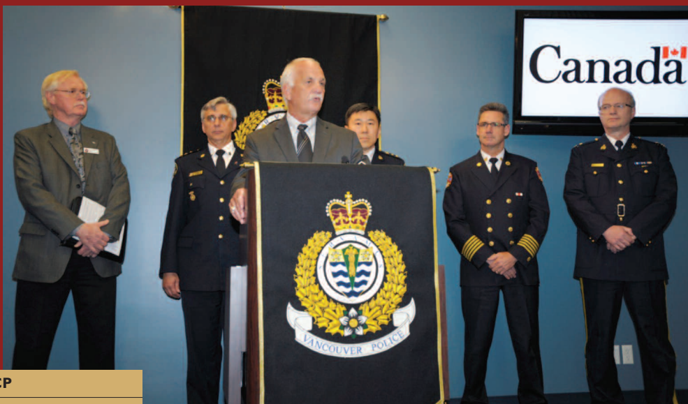
Chief Jim Chu, Président de l'ACCP

Le ministre de la Sécurité publique, Vic Toews, renforce l'engagement du gouvernement à sécuriser le premier bloc de 10 Mhz des 700 MHz pour le réseau de bande passante des intervenants de première ligne de la Sécurité publique