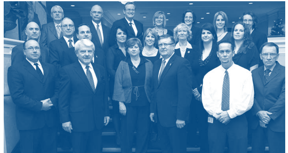
Photo des employés de la Commission d'examen des plaintes concernant la police militaire.

Atelier sur les opérations : Un atelier sur les opérations d'une durée de deux jours a été organisé à l'intention des avocats, des enquêteurs, du personnel du greffe et autres employés de la Commission. Dans le cadre de cet atelier, on s'est penché sur ce qui suit : les pratiques