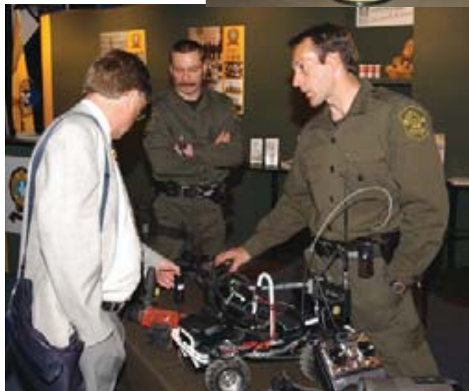
Des membres du groupe d'intervention tactique