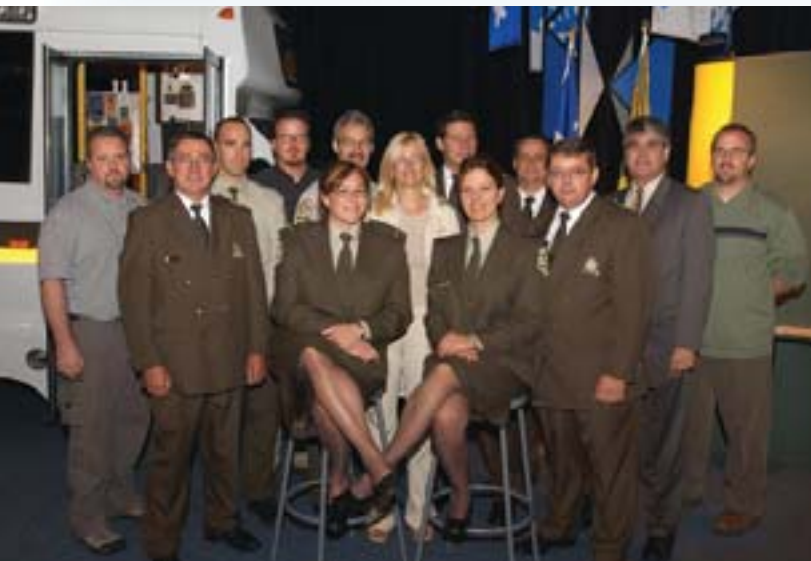
Des membres de la Sûreté du Québec devant le stand

La Sûreté a d'ailleurs fait bonne impression. Plusieurs centaines de congressistes ont visité son stand. Le nouveau poste mobile de proximité qui était aussi sur les lieux a suscité un vif intérêt de la part des représentants municipaux. Les participants ont également pu rencontrer des membres du groupe d'intervention tactique et des unités d'urgence.